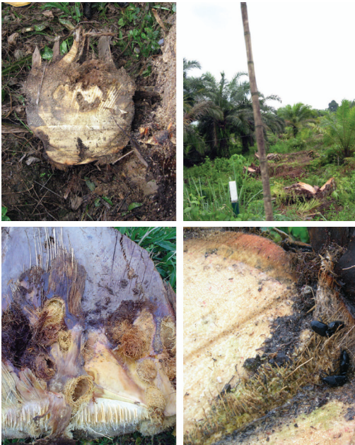
Figura 11: Detalles de residuos de palmas erradicadas de forma incorrecta, con trozos muy gruesos que sirven de local de reproducción para Rhynchophorus palmarum .

En caso de no ser posible el picado de este material se sugiere aplicar un insecticida que contenga como ingrediente activo Fipronil (solución de 1,0cc producto/litro de agua) o Imidacloprid (2,0cc producto/litro de agua) y un coadyuvante directamente en la zona de la corona de las palmas abandonadas o inyectadas con glifosato.