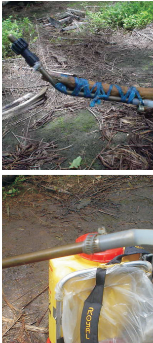
Figura 18: Detalles del aparato para la aplicación del insecticida al cogollo de la palma.

Para aplicaciones en palma joven, se puede utilizar un recipiente plástico de desecho de 1.000cc de capacidad, sujetado a una vara de bambú o tubo de aluminio. Posteriormente se adiciona el producto, se dirige a la zona del cogollo y se hace la aplicación.