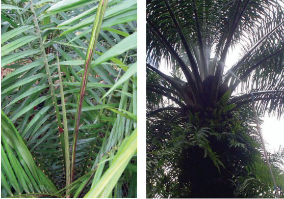
Figura 17: Región del cogollo de plantas donde se debe realizar la aplicación de insecticidas. A la derecha, tratamiento en palma adulta.

previene el ataque del insecto. Bajo las condiciones de Tumaco, por ejemplo, este producto persiste en campo alrededor de 60 días.