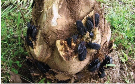
Figura 8: Adultos de Rhynchophorus palmarum alimentándose y ovipositando en cortes realizados en las bases peciolares de plantas de palma de aceite.

En el proceso infectivo o epidémico de las enfermedades el AR y la PC, una palma enferma dentro de un lote se constituye en un sitio para la reproducción de R. palmarum (figura 8).