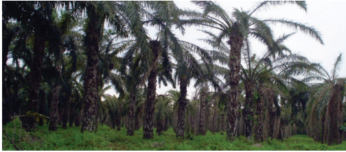
Figura 9: Lotes con palmas enfermas por la Pudrición del cogollo, muy atractivas para Rhyngophorus palmarum .

Este insecto tiene la capacidad de reproducirse en estos estípites por más de un año después de la tumba o la aplicación de glifosato (figura 10).