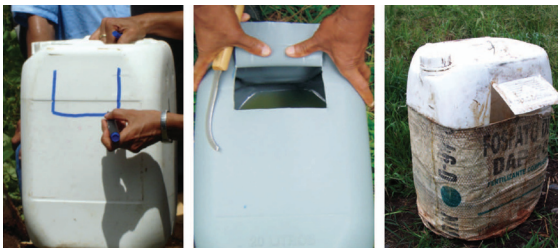
Figura 4: Detalles en la secuencia de cómo marcar el recipiente para la elaboración de la ventanilla para la trampa, cómo debe quedar la ventanilla y la trampa final, ya revestida con la lona.

La trampa consta de un recipiente plástico, una feromona sintética de agregación y un cebo vegetal.