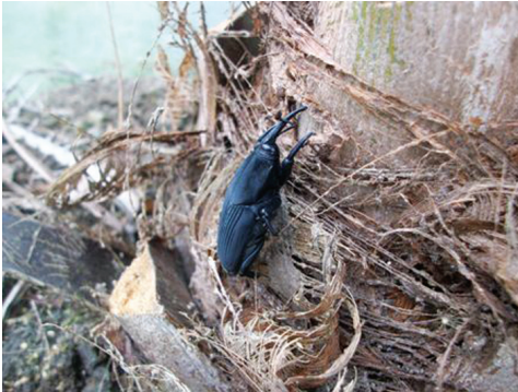
Figura 1: Hembra adulta de Rhynchophorus palmarum ovipositando en una base peciolar de planta de palma de aceite.

Rhynchophorus palmarum es conocido como una plaga de gran importancia económica en el cultivo de la palma de aceite por ser el principal vector de la enfermedad Anillo rojo – Hoja corta (AR). Actualmente, se destaca también por ser una plaga directa del cultivo por su asociación con la enfermedad Pudrición del cogollo (PC) (figura 1).