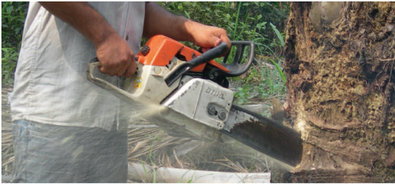
Figura 13: Corte inicial que se debe hacer con la motosierra para la aplicación del MSMA.

Para la aplicación del herbicida, con un taladro, motosierra o punzón, se hacen dos orificios en el estípote de modo que queden sobre tejido funcional para que la aplicación sea eficaz (figuras 13 y 14). Si el tejido que sale del orificio es funcional, tiene una coloración de color crema.