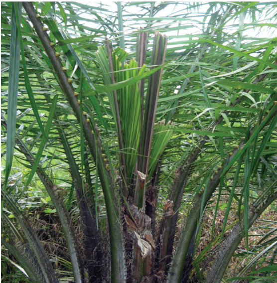
Figura 16: Palma enferma por la Pudrición del cogollo, con cirugía y que debe recibir tratamiento a base de insecticidas para evitar el ataque de Rhynchophorus palmarum en los tejidos expuestos.

La aplicación de 500cc de una solución, en la zona del cogollo de las palmas enfermas, que contenga Fipronil (1,0cc producto/litro de agua) o Imidacloprid (2,0cc producto/litro de agua) o Carbaril (2g producto/litro de agua) y un coadyuvante,