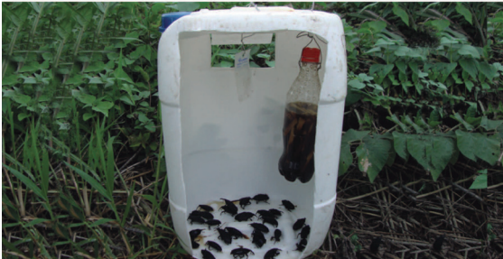
Figura 5: Trampa cortada longitudinalmente para mostrar cómo quedan la feromona y el cebo instalados en su interior.

Se cuelga dentro del recipiente plástico de modo que quede paralela a las ventanas laterales, y se debe cambiar cada tres meses.