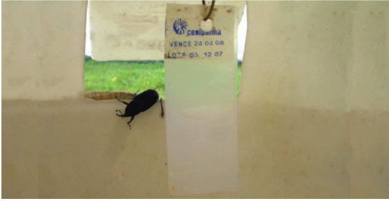
Figura 6: Adulto de Rhynchophorus palmarum caminando para entrar a la trampa por la ventanilla.