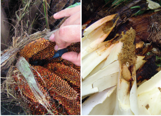
Figura 2: Adulto de Rhynchophorus palmarum causando daños en una flor de palma de aceite (izquierda) y larvas de Rhynchophorus palmarum en el interior del tejido ya en descomposición (derecha).

Los adultos de R. palmarum son atraídos por la fermentación de los tejidos de palmas en estado avanzados de la PC o cortes ocasionados por poda o cosecha (figura 2).