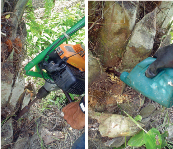
Figura 12: Detalle de la utilización correcta del taladro para la aplicación del herbicida MSMA, en la erradicación de palma en campo (izquierda) y el tratamiento con insecticida en la base de la palma donde se reproduce Rhynchophorus palmarum .

Uno de los pasos en el manejo de R. palmarum , es la erradicación de palmas enfermas o de renovación. La aplicación de 100cc del herbicida sistémico Metanoarsonato monosódico (MSMA), mediante la inyección del producto al estípote, evita la colonización de este insecto (figura 12). En la actualidad se adelantan trabajos con el fin de seleccionar otros herbicidas que impidan el desarrollo de esta plaga.