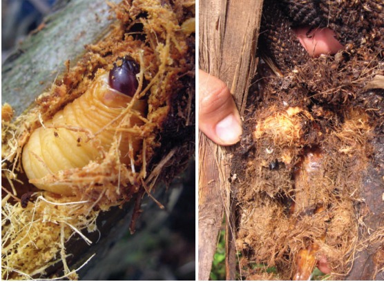
Figura 3: Detalle de la larva de Rhynchophorus palmarum y parte de una flor con daños provocados por esta larva.

daños al meristemo, inducir la muerte de la palma o facilitar el desarrollo de pudriciones por patógenos (hongos o bacterias) (Sánchez et ál., 1993). En palma de aceite tres larvas son suficientes para matar una palma de seis meses de llevada al sitio definitivo (Calvache, comunicación personal, 2005) (figura 3). En cultivos de renovación y en zonas con altas poblaciones de R. palmarum se debe tener especial cuidado, porque aunque las palmas estén sanas, cualquier corte (poda o cosecha) aumenta su vulnerabilidad al ataque del insecto, principalmente en zonas donde se presenta alta incidencia de la PC.