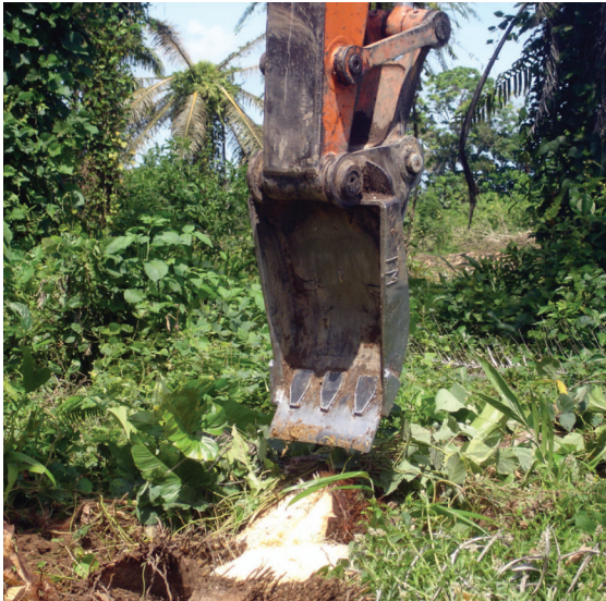
Figura 15: Erradicación mecánica por medio de una excavadora.

De esta manera no solo se evita la reproducción de R. palmarum , sino de Strategus aloeus .