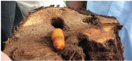
Figura 10: Detalle de un estípite con la larva de Rhyngophorus palmarum y su galería.