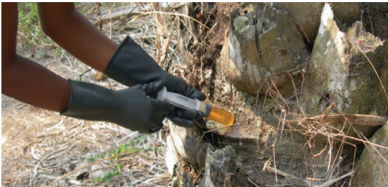
Figura 14: Aplicación del herbicida MSMA por medio de una jeringa.