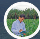
Asistencia Técnica y Acompañamiento

Obten más información en: www.cenipalma.org +57 (1) 208 8660 Ext 3000 - 3001