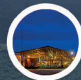
Auditorías Técnicas y de Seguimiento