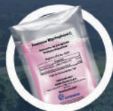
Feromona Rhynchophorol C