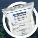
Polinizador Artificial 98%