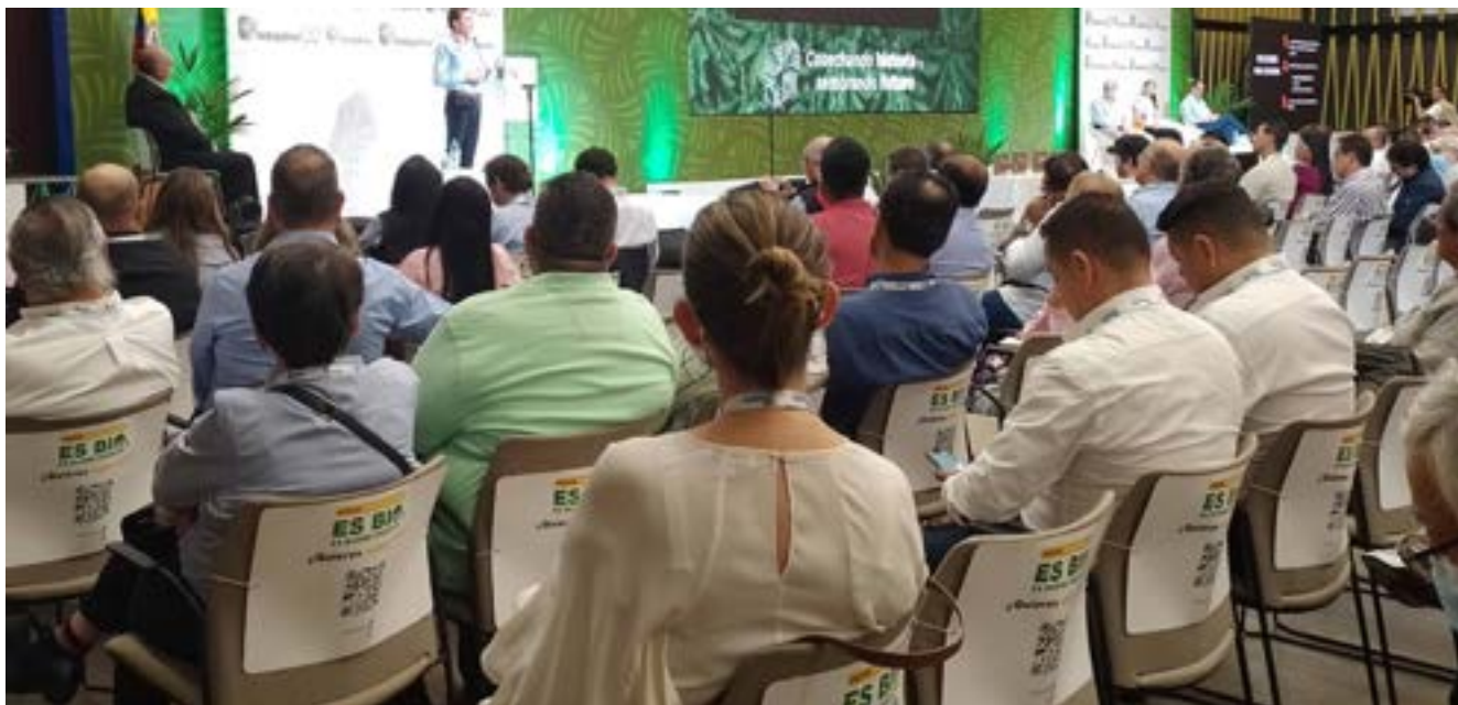
Figura 25. Durante el 50° Congreso Nacional de Cultivadores de Palma de Aceite se llevó a cabo el Evento de Sostenibilidad.