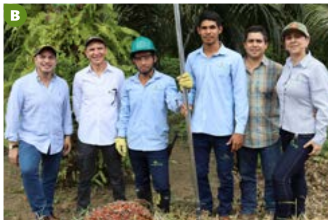
Figura 22. a) Intervención del Presidente Ejecutivo de Fedepalma en la sesión descentralizada en Montería, Córdoba de la Comisión V de la Cámara de Representantes. b) Visita de familiarización con congresistas, Finca Inversiones Mindalá, Córdoba