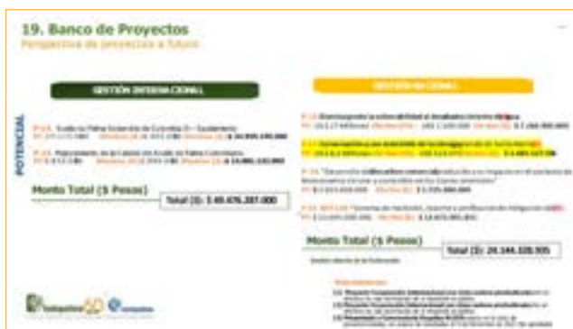
Figura 23. Proyectos gestionados durante la vigencia 2022.