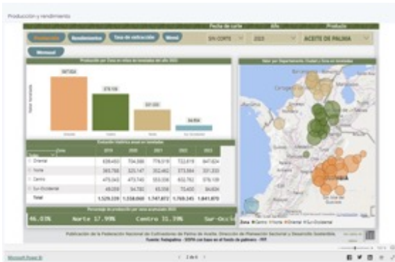
▲ Figura 8. Sispa plus