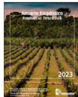
▲ Anuario Estadístico 2023