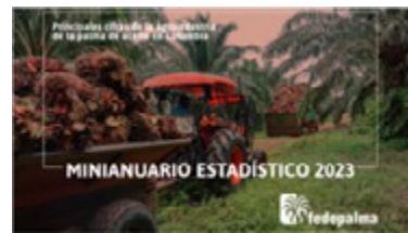
▲ Minianuario Estadístico 2023