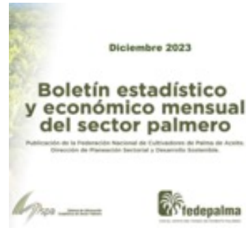
▲ Boletines estadísticos y económicos mensuales

Con el fin de proporcionar información oportuna, completa y consistente sobre las principales variables del sector palmero colombiano, Fedepalma realizó la divulgación de las estadísticas más relevantes para el sector palmero a través de los siguientes productos: