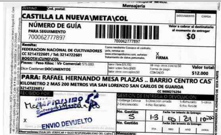
IMAGEN PRUEBA DE ENTREGA