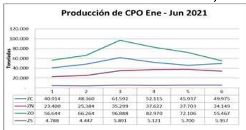
Tabla 3. Producción CPO al 30 de junio de 2021 y año terminado 31 de diciembre de 2020

La tabla 3 muestra el comportamiento de la producción mes a mes de enero a junio de 2021 y el comportamiento presentado durante el año terminado el 31 de diciembre de 2020.