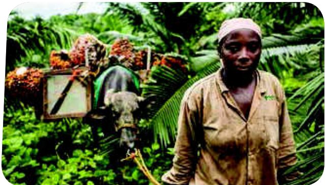
“Atardecer en el palmar” Diego Fernando Patiño Pérez