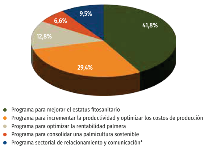
Figura 2. Distribución de recursos del FFP según objetivo estratégico sectorial, 2019-2023**

Entre 2019 y 2023 los retos sectoriales se homologaron con programas de inversión a los que se asignan los recursos del FFP. La Figura 2 presenta la distribución de estos recursos en ese período. Los recursos destinados a los programas para mejorar el estatus fitosanitario y para incrementar la productividad y optimizar los costos de producción, han constituido en promedio el 70,3% de la inversión sectorial en este periodo, corroborando la importancia que tienen estas dos temáticas para el subsector de la palma de aceite.