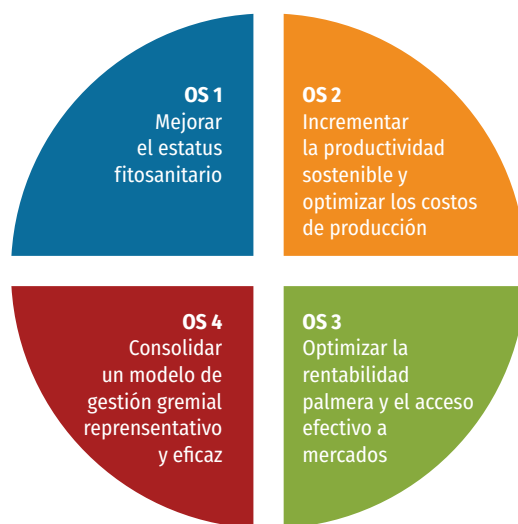
Figura 4. Retos/objetivos sectoriales

Estos objetivos sectoriales se desarrollan en programas de inversión a los que se destinan los recursos del FFP 3 y estos programas, a su vez, se despliegan en un conjunto de lineamientos específicos que consisten en estrategias para contribuir, desde el gremio, al logro de los objetivos. Dichas estrategias conforman un marco de referencia para que se formulen y prioricen proyectos de inversión con entregables concretos de utilidad para el palmicultor. El despliegue de los objetivos sectoriales en lineamientos específicos se presenta en la Figura 5.