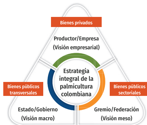
Figura 1. Articulación de actores involucrados en el desarrollo de la agroindustria de la palma de aceite

El engranaje sectorial de la agroindustria sobre el que se construye esta visión compartida incluye tres actores clave (Figura 1) que se articulan en beneficio del crecimiento y desarrollo del sector: los palmicultores (nivel empresarial), Fedepalma (nivel meso) y el Gobierno (nivel macro). En el caso de los primeros, sus decisiones de inversión y adopción tecnológica, así como sus prácticas gerenciales, orientan sus resultados económicos y su capacidad de innovación. En cuanto a Fedepalma, como el gremio de los palmicultores, contribuye a la articulación del engranaje sectorial, tanto en la generación de bienes públicos sectoriales (apoyándose, entre otras cosas, en los instrumentos de la parafiscalidad palmera), como en la influencia que tiene en acciones del Gobierno y de los productores. Finalmente, el Gobierno (en sus distintos niveles, nacional, departamental y municipal) es el responsable de que se formulen e implementen políticas públicas que permitan la provisión de bienes públicos transversales y de que se emita normatividad coherente con el desarrollo sectorial.